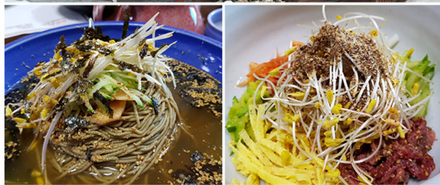
請向餐飲店查詢Visa專享的特別優惠 14