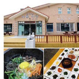
五台山首爾飯店 오대산 서울식당