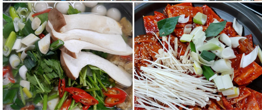
請向餐飲店查詢Visa專享的特別優惠 20