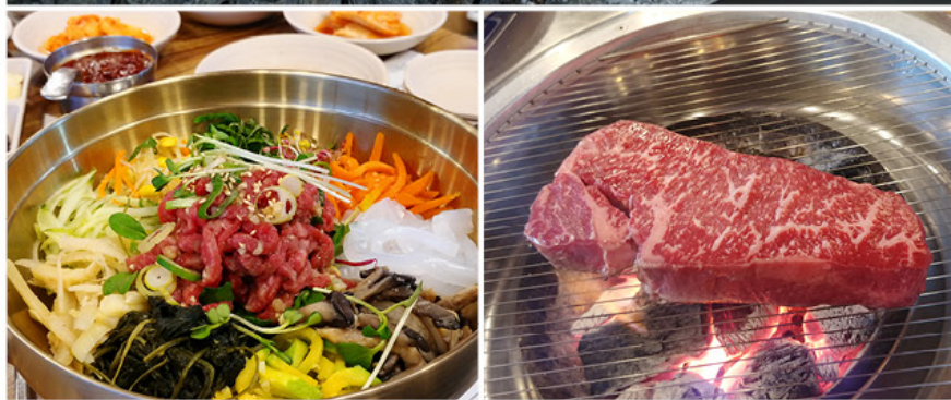
13 PyeongChang 2018 Visa Dining Offer