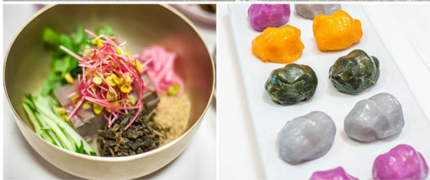
19 PyeongChang 2018 Visa Dining Offer